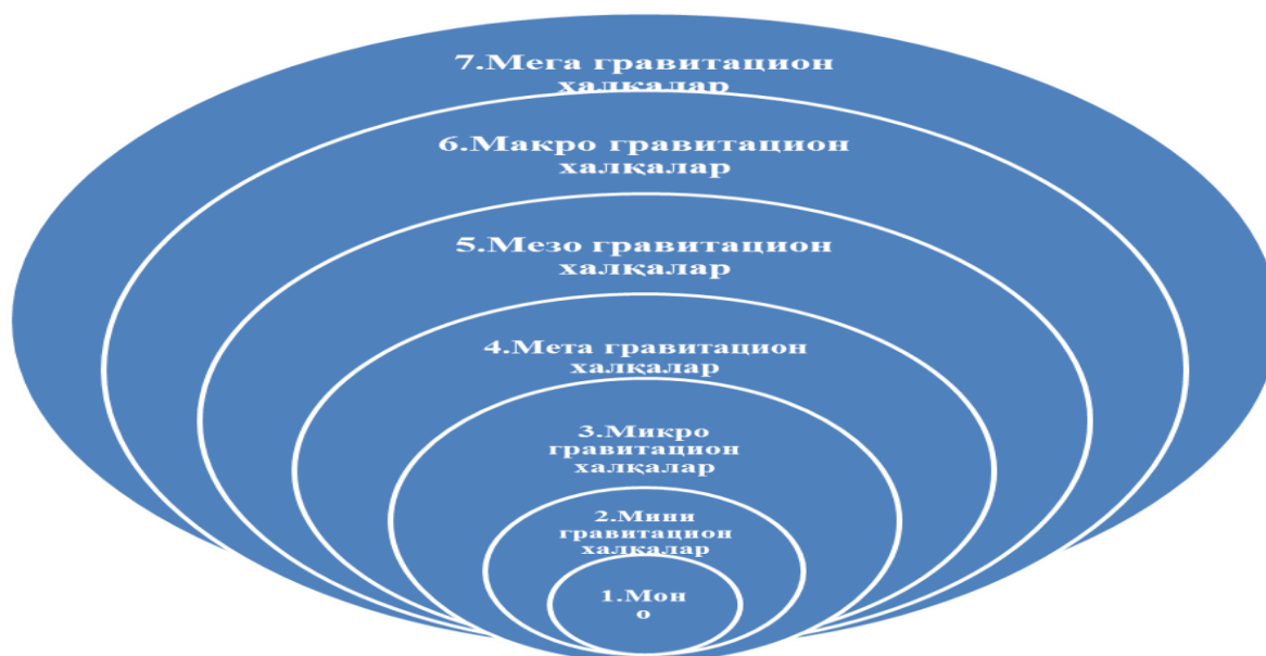
3-расм. Рекреацион фаолиятдаги гравитацион халқалар 31

Ушбу гравитацион халқалар, авваламбор, рекреацион объектларнинг ҳозирги кундаги жозибadorлиги ва устуворлигини белгилашда ҳамда маълум даражада хулосалар қилишга имконият беради.