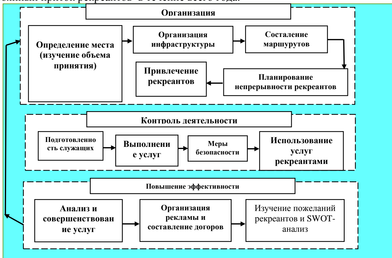
Рисунок 1. Вариант оптимального расположения рекреационно-туристических объектов 52

Первый этап. При создании рекреационных объектов сначала необходимо определить местоположение и изучить потенциал зоны рекреационных ресурсов, а также расширить возможности рекреационного объекта, выбрав, таким образом, подходящее место для рекреационного объекта. Затем необходимо создать инфраструктуру, нанять рекреантов, разработать маршруты и обеспечить постоянный приток рекреантов в течение всего года.