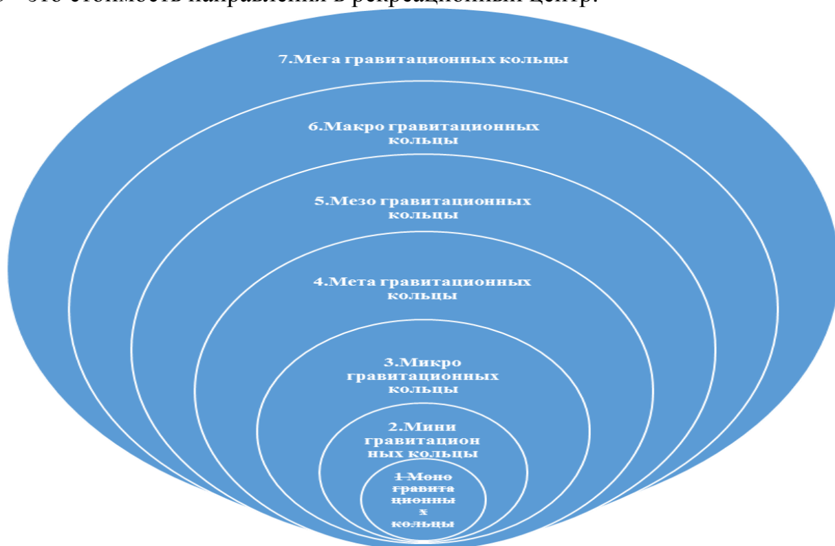
Рисунок 3. Гравитационные кольца в рекреационной деятельности 62

X3 - это стоимость направления в рекреационный центр.